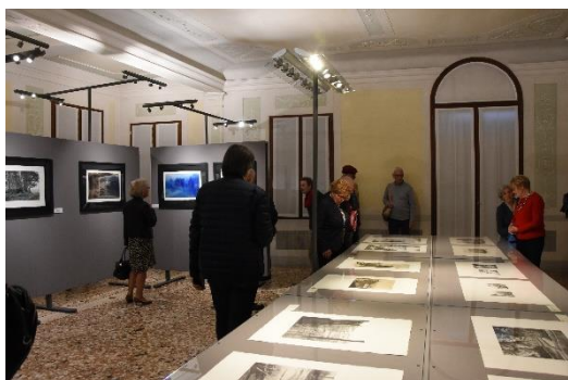
Mostra Italia-Giappone alla Fondazione Benetton di Treviso