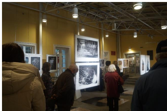
Mostra opere dell'Associazione alla Galeria Stary Ratusz, Olsztyn, Polonia