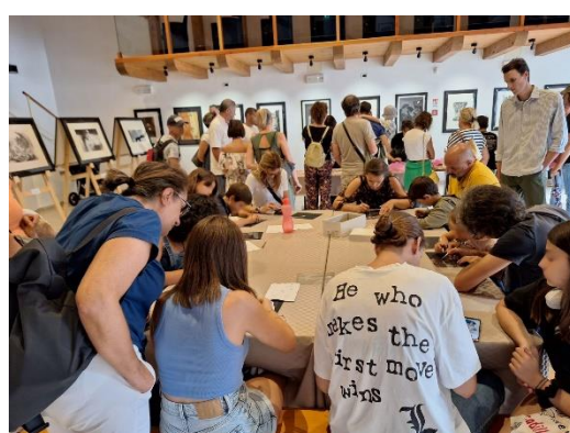
Laboratorio di incisione e stampa per i visitatori di una mostra