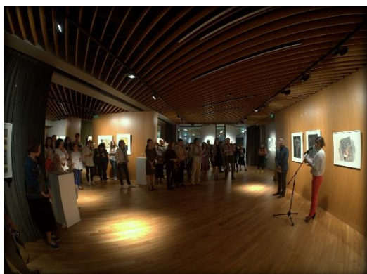
Mostra Bulgaria-Italia alla San Stefano Gallery di Sofia.