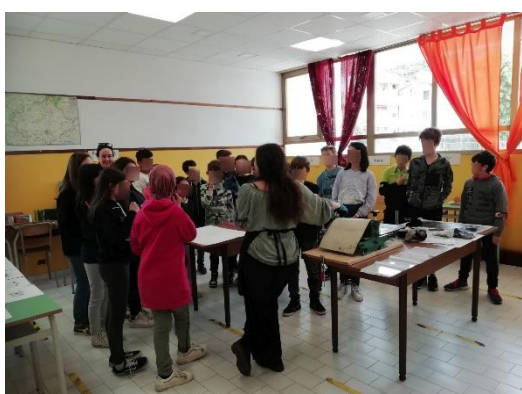
Lezione di stampa con studenti di una classe della scuola secondaria di primo grado